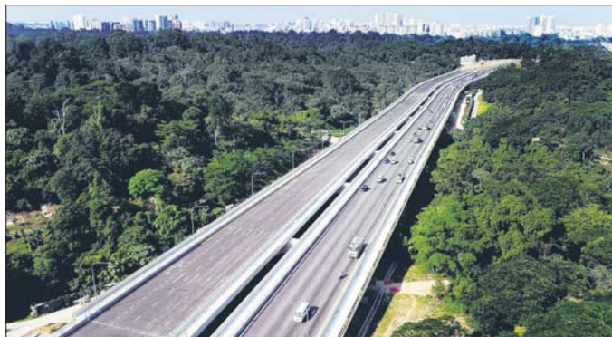
一旦罗尼大道北向路段开放后，预计能舒缓罗尼路在高峰时段常见的堵车情况。

通往麦里芝高架桥的罗尼大道北向路段、亚当路地下车道和森路地下车道北向路段则会在4月19日凌晨3时正式开放。